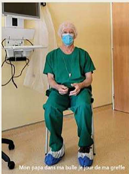
Mon papa dans ma bulle le jour de ma greffe

L'amitié comme l'Amour sont des feux sacrés, mais parfois on se retrouve à souffler sur des braises à moitié éteintes, nostalgiques d'une époque révolue, parsemée de souvenirs qui ne sont plus ; tant la vie nous conduit à prendre des directions qui peuvent être diamétralement opposées, et on se raccroche à la petite branche