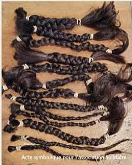
Acte symbolique pour l'association Solidaire

Accompagnée de mon amie Véronique coiffeuse à « Deux pièces plus cuisine », et de mon amie Cindy, elles ont su rendre ce moment symbolique comme un baume sur mon âme la veille de mon entrée à l'hôpital le 28 juin 2022.