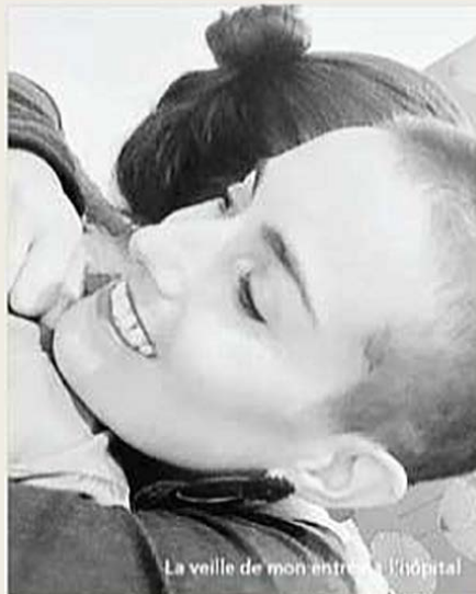
La veille de mon entrée à l'hôpital

de l'arbre prête à céder à chaque intempérie. Quand on se sent malmené, abîmé dans sa sensibilité ou qu'on empiète sur nos limites, il est urgent que l'amitié parte en vacances, et si ce n'est pas suffisant de faire un deuil de certaines situations ou de certaines personnes qui nous brident, pour prendre toute notre place au centre de notre vie.