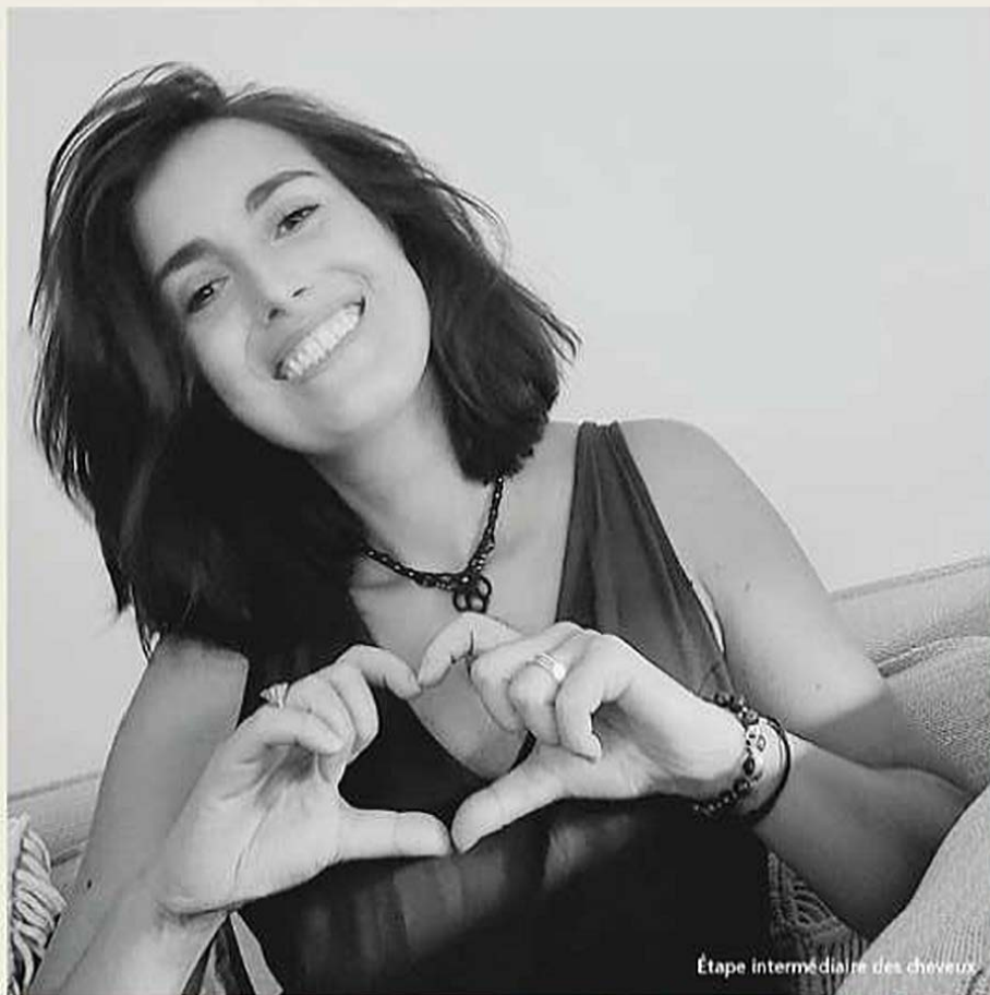
Étape intermédiaire des cheveux

J'ai changé mon alimentation, j'ai dit au revoir au sucre, au lait de vache, au gluten et à tout ce qui pouvait procurer de l'inflammation à ce corps déjà bien attisé.