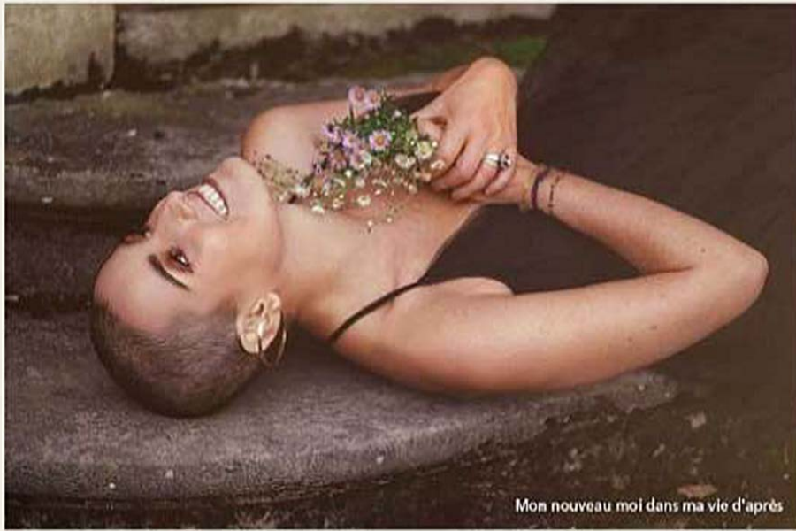
Mon nouveau moi dans ma vie d'après

Serrer ma CHANCE d'avoir un jour partagé vos vus.