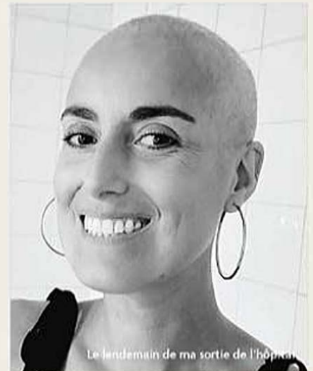
Le lendemain de ma sortie de l'hôpital

la bienveillance ; simple et rapide à réaliser, vous n'avez besoin que d'une feuille et d'un stylo.